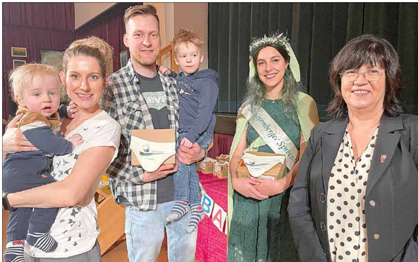
Babyempfang am 31. März 2023