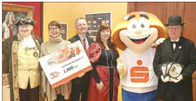
Bei der Scheckübergabe im Spremberger Schloss

Die Sparkasse Spree-Neiße unterstützt mit einem Zweckbetrag aus Mitteln des 30 Jahre PS-Lotterie-Sparens 2023 den Heimatkalender „Stadt Spremberg und Umgebung“ mit 1000,00 €. Für diese Unterstützung bedankt sich der Spremberger Kulturbund e. V. recht herzlich.