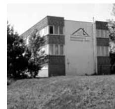
Im Haus der NBL - Gebäudeservice