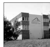
Ort: Kraftwerkstraße 45 in 03130 Spremberg