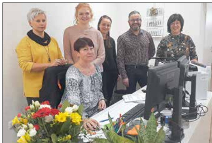
Eröffnung des Bürgerbüros in den neuen Räumlichkeiten Bahnhofstraße 1

Wir bitten um Verständnis und freuen uns auf Ihren Besuch.