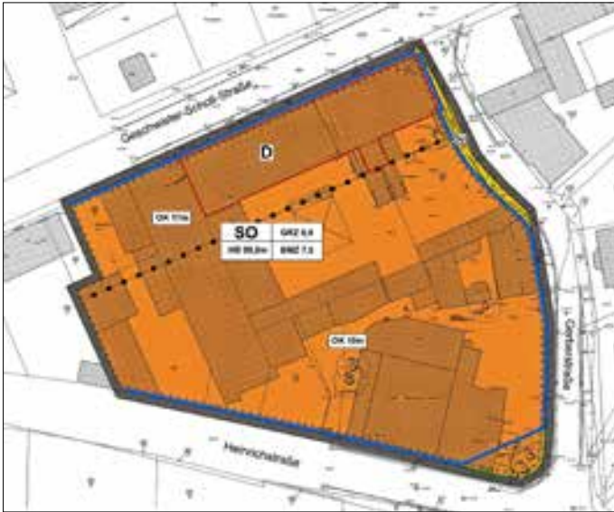
Übersichtsplan 1. Änderung des B-Planes Nr. 76 „Sondergebiet Heinrichstraße/Geschwister-Scholl-Straße“