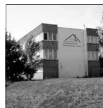
Im Haus der NBL - Gebäudeservice

Ort: Kraftwerkstraße 45, in 03130 Spremberg